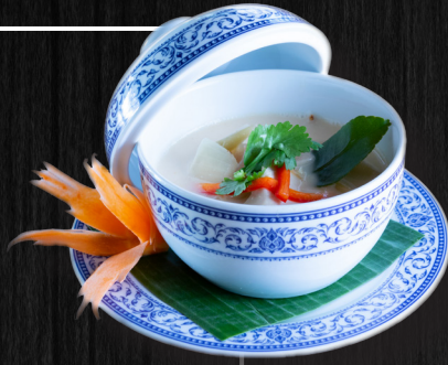
“Tom Yum Kung” Garnelensuppe